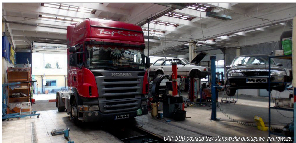
CAR-BUD posiada trzy stanowiska obsługowo-naprawcze.

Obecnie warsztat świadczy usługi w zakresie napraw bieżących i obsługi wszystkich układów pojazdów, łącznie z klimatyzacją i elektroniką pokładową z wykorzystaniem najnowszych diagnostyk samochodowych oraz usługi związane z naprawami silników pojaz-