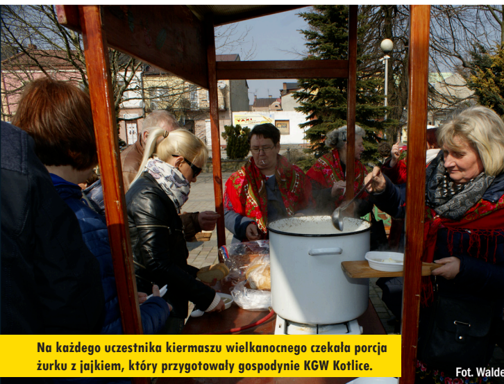
Na każdego uczestnika kiermaszu wielkanocnego czekała porcja żurku z jajkiem, który przygotowały gospodynie KGW Kotlice.