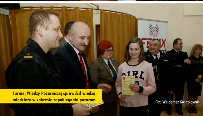
Turniej Wiedzy Pożarniczej sprawdzał wiedzę młodzieży w zakresie zapobiegania pożarom.