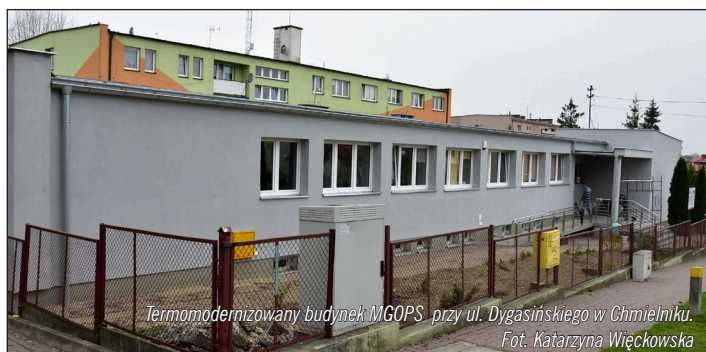
Termomodernizowany budynek MGOPS przy ul. Dygasińskiego w Chmielniku.