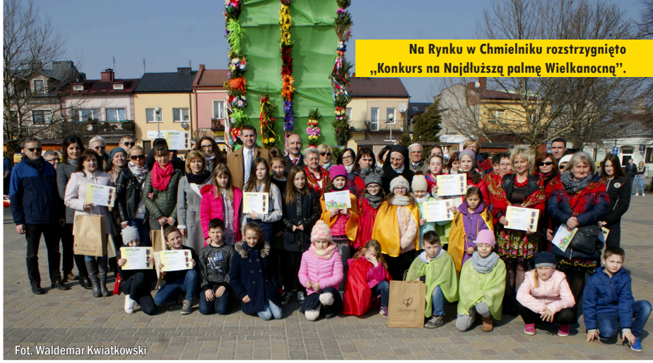
Na Rynku w Chmielniku rozstrzygnięto „Konkurs na Najdłuższą palmę Wielkanocną”.