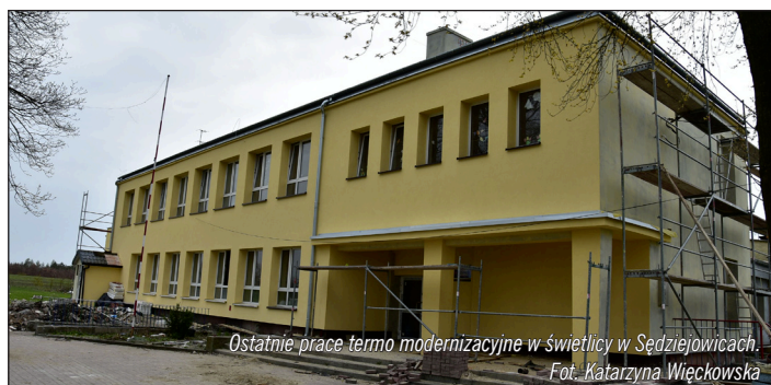
Ostatnie prace termomodernizacyjne w świetlicy w Sędziejowicach.