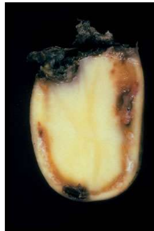
Fot. 1. Przekrój przez porażoną bulwę z zamierającymi wiązkami przewodzącymi

bakteria wywołująca chorobę ziemniaków zwaną śluzakiem (brązową zgnilizną lub brunatną zgnilizną ziemniaka)