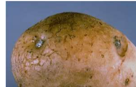
Fot 3 i 4. Wyciek śluzu z oczek bulwy i przekrój przez porażoną bulwę z zamierającymi wiązkami przewodzącymi