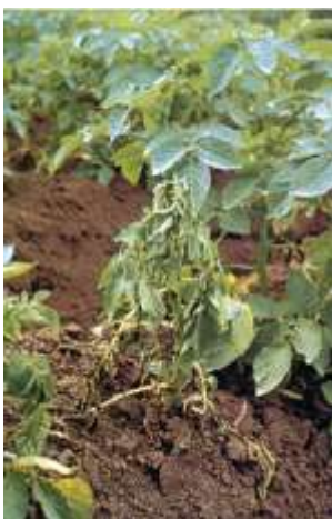
Fot 1 i 2. Wędnące rośliny ziemniaka