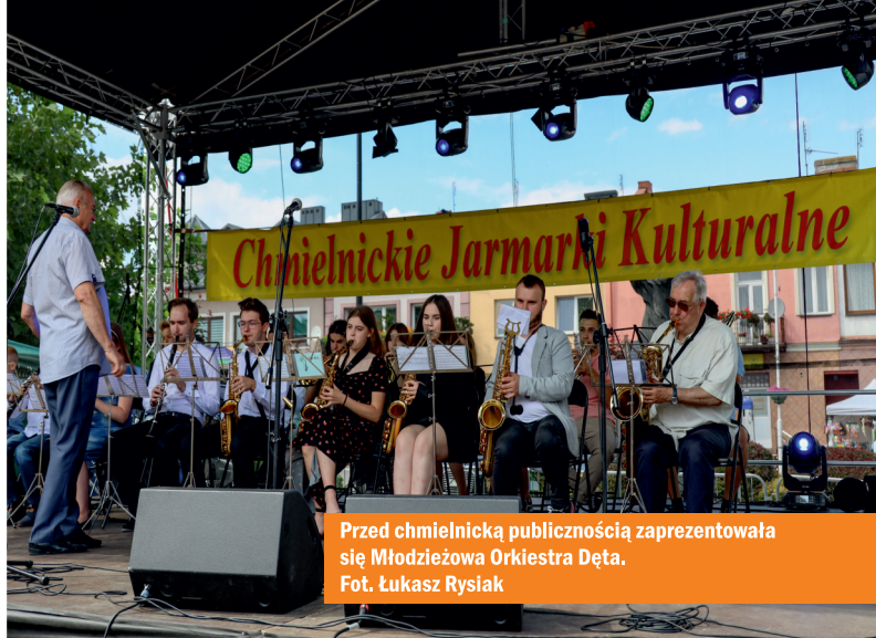
Przed chmielnicką publicznością zaprezentowała się Młodzieżowa Orkiestra Dęta.