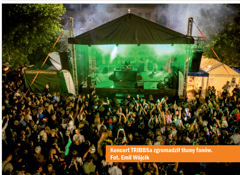
Koncert TRIBBSa zgromadził tłumy fanów.