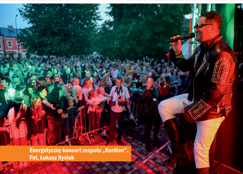
Energetyczny koncert zespołu „Kordian”.