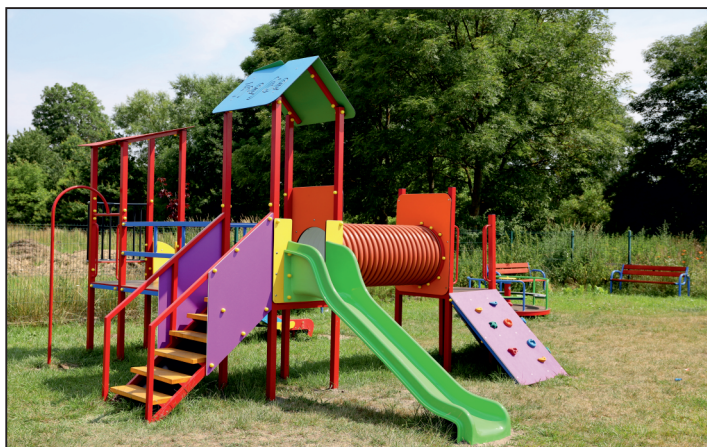
Plac zabaw w Borzykowie.