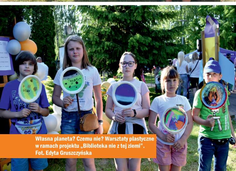
Własna planeta? Czemu nie? Warsztaty plastyczne w ramach projektu „Biblioteka nie z tej ziemi”.