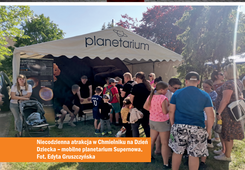
Niecodzienna atrakcja w Chmielniku na Dzień Dziecka – mobilne planetarium Supernowa.