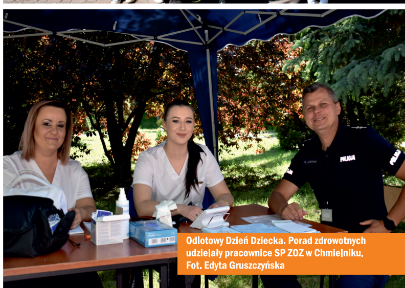
Odlotowy Dzień Dziecka. Porad zdrowotnych udzielały pracownice SP ZOZ w Chmielniku.