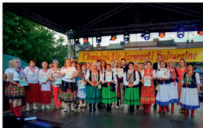
Nagrodzeni w konkursie pierogowym

„Bobróweczki” z ciasta parzonego, z bobem, suszonymi pomidorami, czosnkiem, cebulą w sosie śmietankowym z bazylią i miętą wystawiło do konkursu KGW „Młodzi Duchem” z Chmielnika.