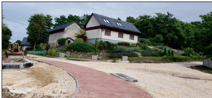
Przepust drogowy w Lubani.