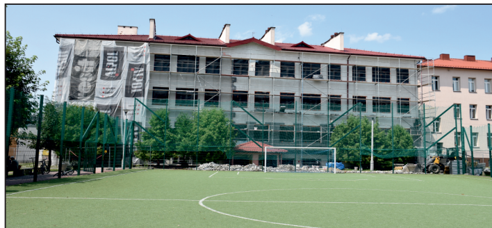
Termomodernizacja szkoły w Chmielniku.