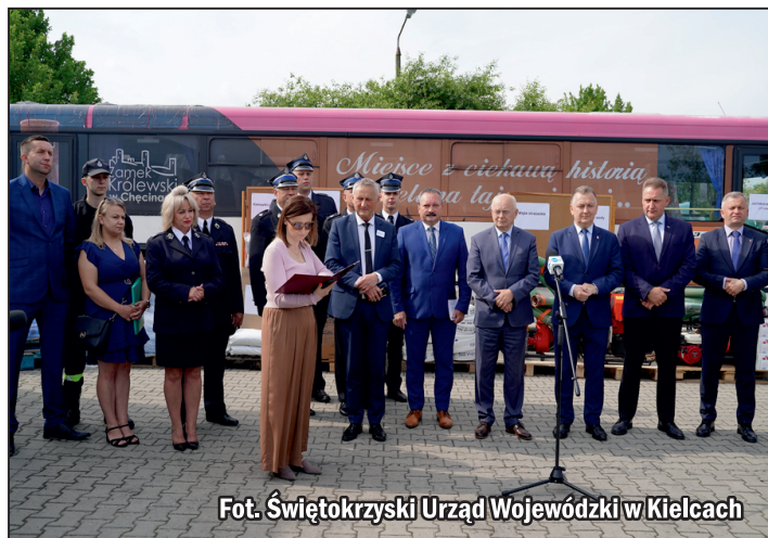
Fot. Świętokrzyski Urząd Wojewódzki w Kielcach