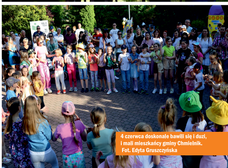
4 czerwca doskonale bawili się i duzi, i mali mieszkańcy gminy Chmielnik.