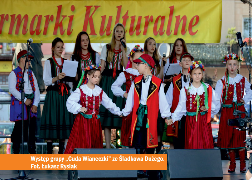
Występ grupy „Cuda Wianeczki” ze Śladowka Dużego.