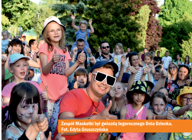
Zespół Maskotki był gwiazdą tegorocznego Dnia Dziecka.