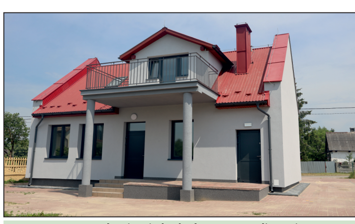
Termomodernizacja budynku OSP w Suliszowie.