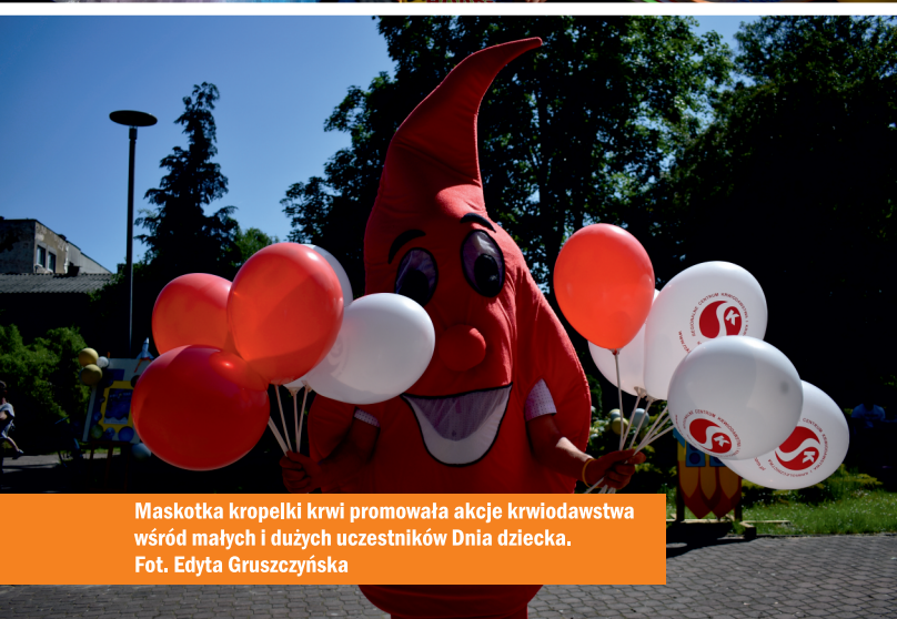
Maskotka kropelki krwi promowała akcje krwiodawstwa wśród małych i dużych uczestników Dnia dziecka.