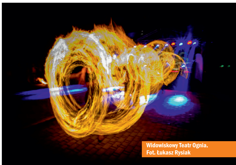
Widowiskowy Teatr Ognia.