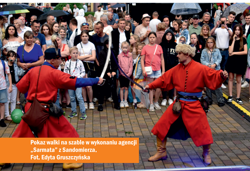
Pokaz walki na szable w wykonaniu agencji „Sarmata” z Sandomierza.