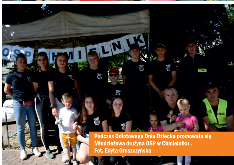
Podczas Odlotowego Dnia Dziecka promowała się Młodzieżowa drużyna OSP w Chmielniku .