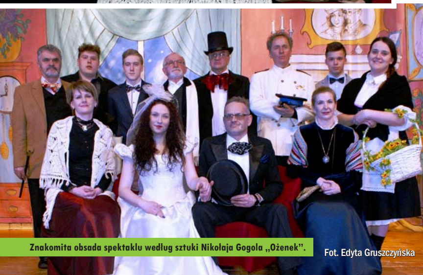
Znakomita obsada spektaklu według sztuki Nikołaja Gogola „Ożenek”.