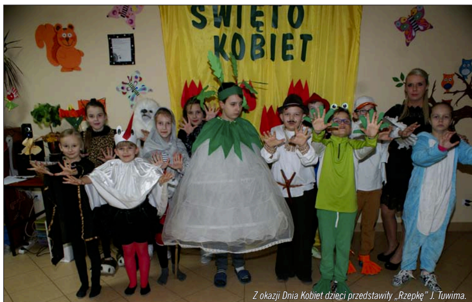
Z okazji Dnia Kobiet dzieci przedstawiły „Rzepkę” J. Tuwima.

Dzień Kobiet to wspaniałe święto, nic więc dziwnego, że w gminie Chmielnik pamiętamy o nim szczególnie.