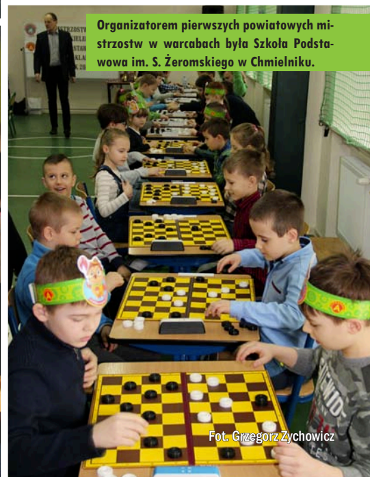
Organizatorem pierwszych powiatowych mistrzostw w warcach była Szkoła Podstawowa im. S. Żeromskiego w Chmielniku.