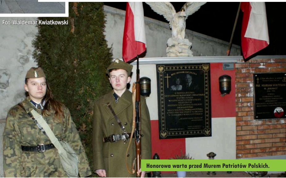
Honorowa warta przed Murem Patriotów Polskich.