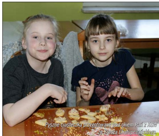
Pyszne ciasteczka przygotowane pod okiem Pań z K&W ze Złocza Chalupczakańskiego.

Tekst: Alicja Adach-Białowas