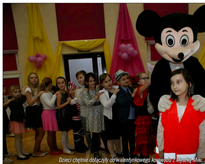
Dzieci chętnie dołączyły do walentynkowego korowodu z Myszką Miki.