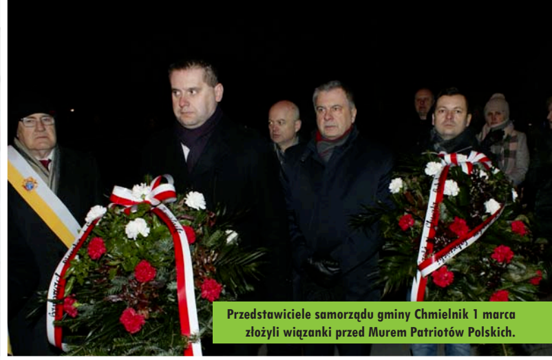
Przedstawiciele samorządu gminy Chmielnik 1 marca złożyli wiązanki przed Murem Patriotów Polskich.