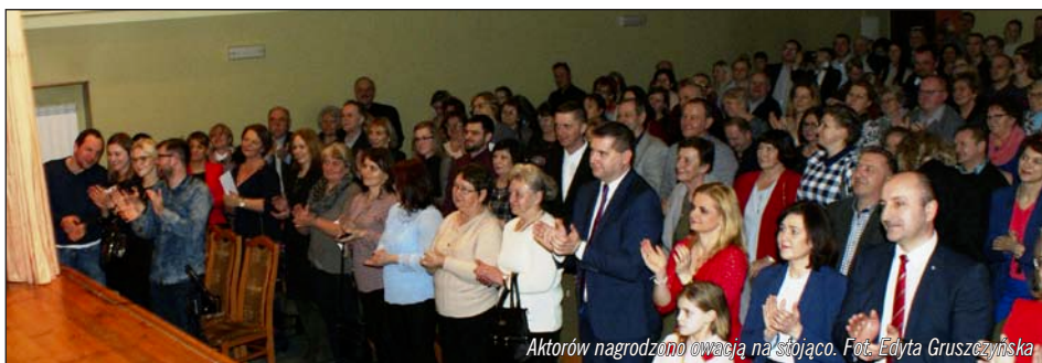
Aktorów nagrodzono owacją na stojąco.