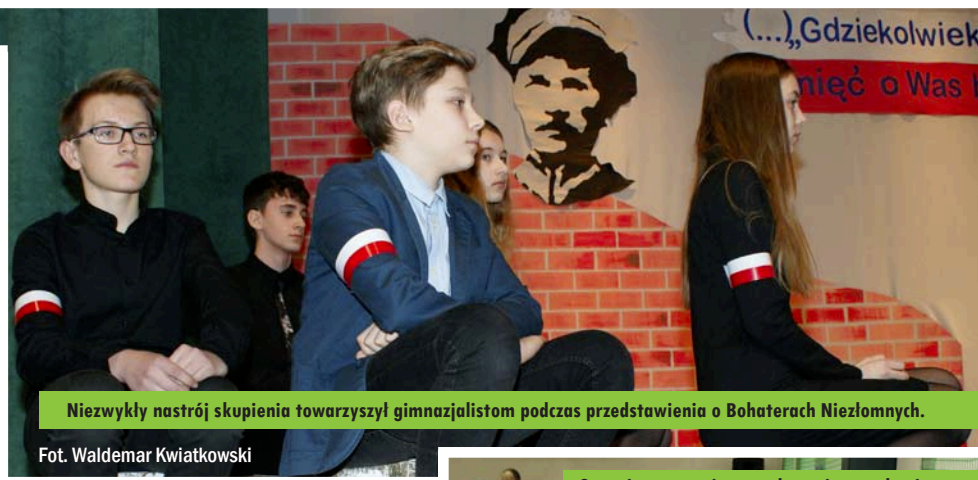
Niezwykły nastrój skupienia towarzyszył gimnazjalistom podczas przedstawienia o Bohaterach Niezlomnych.