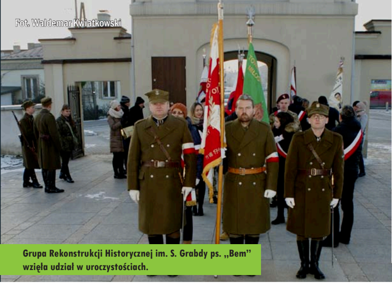
Grupa Rekonstrukcji Historycznej im. S. Grabdy ps. „Bem” wzięła udział w uroczystościach.