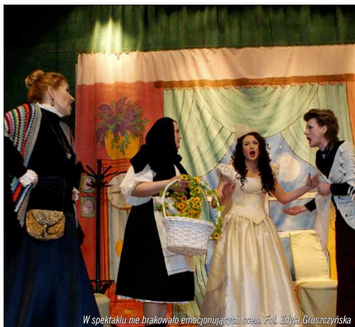
W spektaklu nie brakowało emocjonujących scen.

na pokojówka i najlepsza przyjaciółka – Jasia ( Marta Brzyszczyk ). Sztuka przepelniona jest ciekawymi zwrotami akcji, zabawnymi dialogami i barwnymi postaciami.