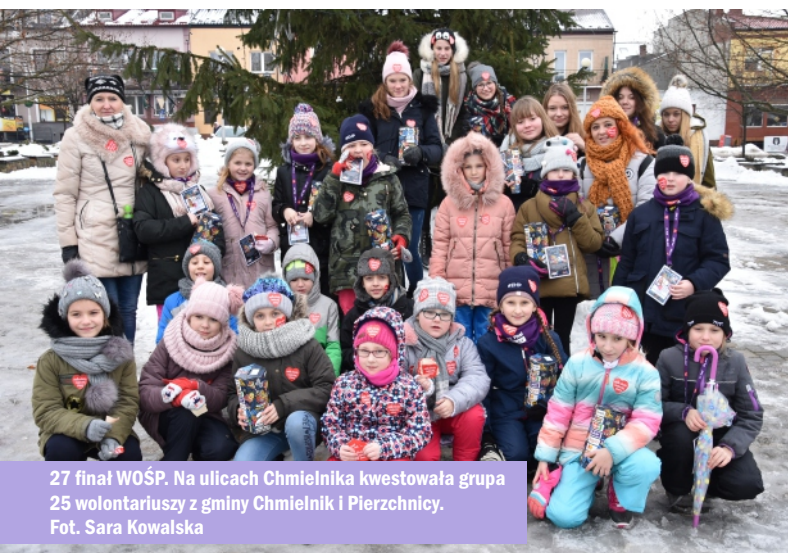
27 finał WOŚP. Na ulicach Chmielnika kwestowała grupa 25 wolontariuszy z gminy Chmielnik i Pierzchnicy.