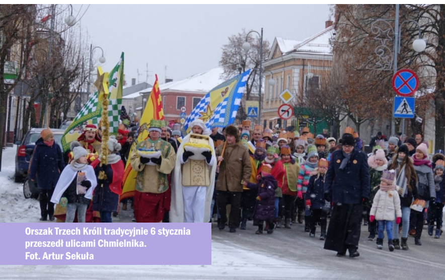
Orszak Trzech Króli tradycyjnie 6 stycznia przeszedł ulicami Chmielnika.