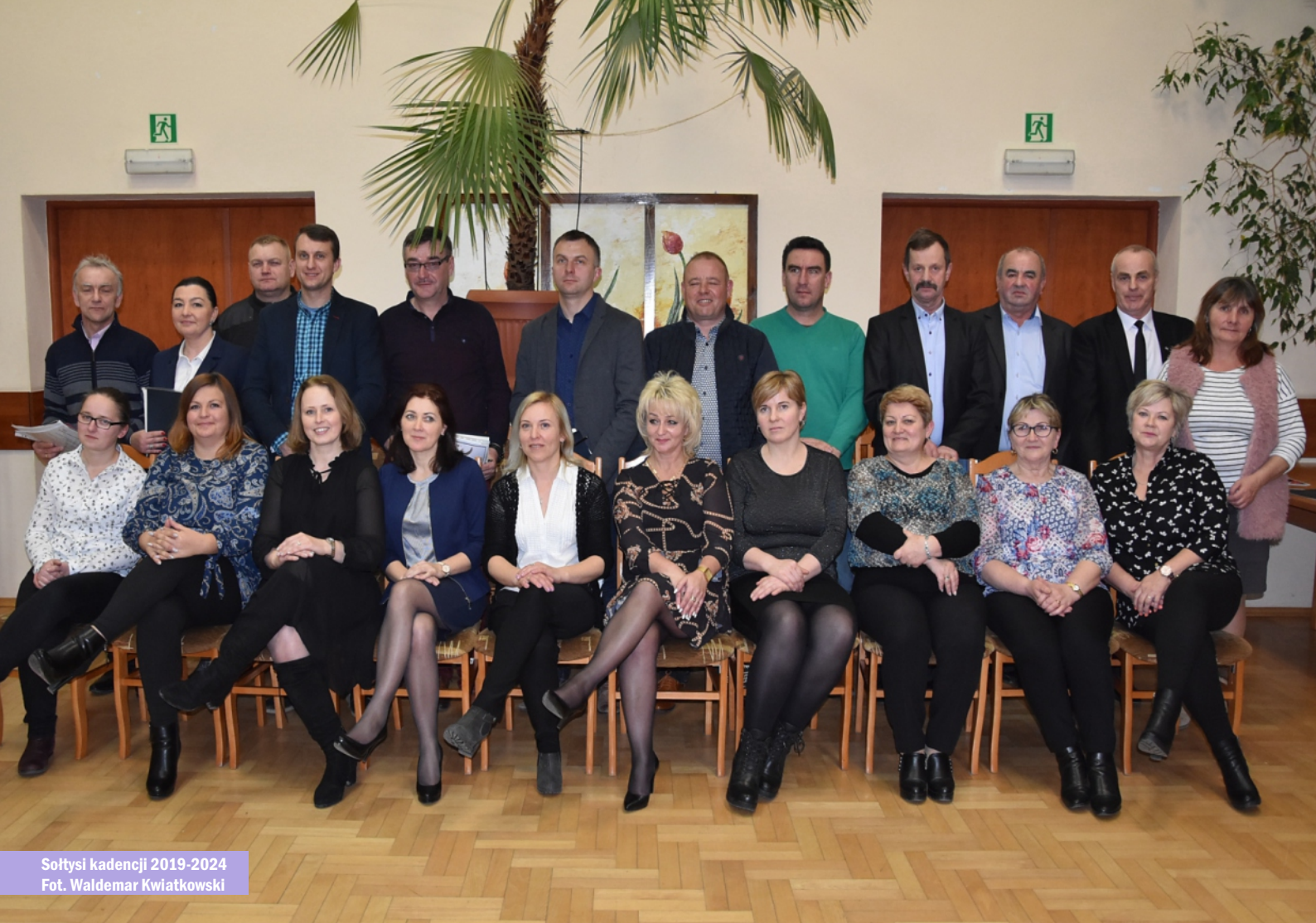
Sołtysi kadencji 2019-2024