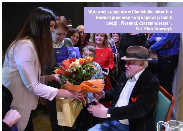
W dawnej synagodze w Chmielniku aktor Jan Nowicki promował swój najnowszy tomik poezji „Piosenki, czasem wiersze”.