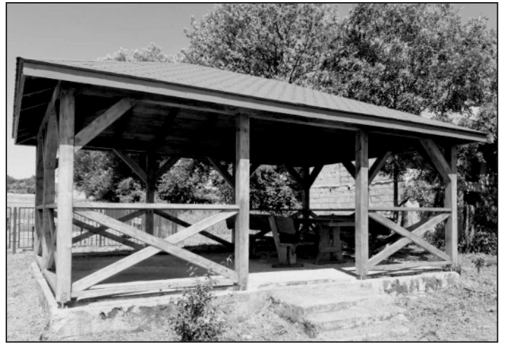
Altana w Szyszczykach

Śladków Duży: remont drogi wewnętrznej, remont drogi gminnej Śladków Duży-Pomyków, doposażenie siłowni zewnętrznej, zakup 3 sztuk koszy na śmieci do sołectwa, organizacja festynu wiejskiego "Śladków Duży w hołdzie dla Niepodległej".