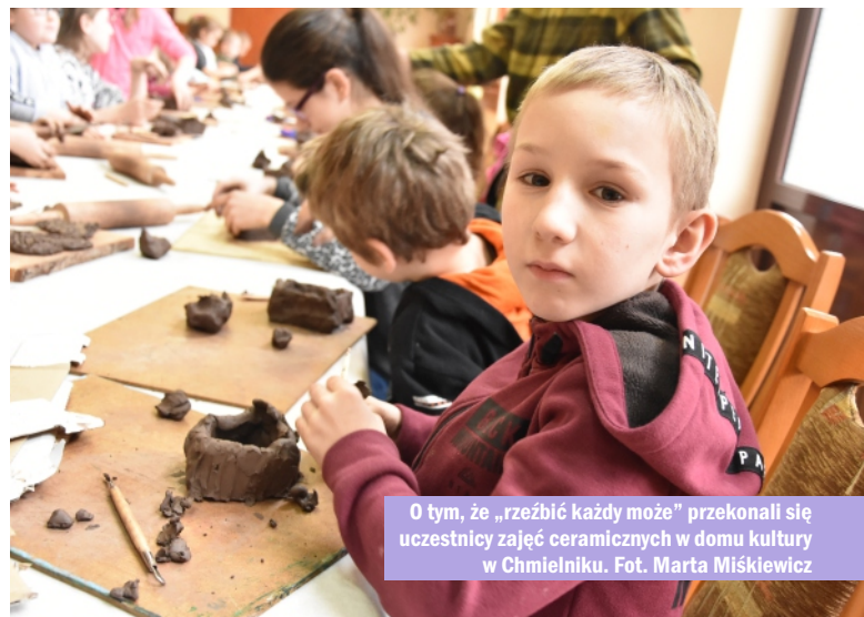
O tym, że „rzeźbić każdy może” przekonali się uczestnicy zajęć ceramicznych w domu kultury w Chmielniku.