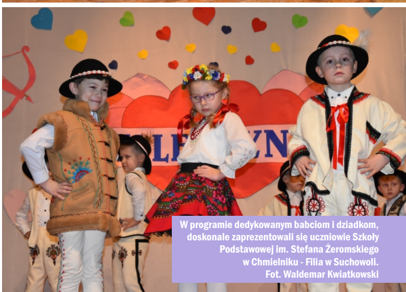
W programie dedykowanym babciom i dziadkom, doskonale zaprezentowali się uczniowie Szkoły Podstawowej im. Stefana Żeromskiego w Chmielniku - Filia w Suchowoli.