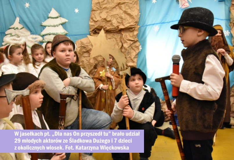
W jasełkach pt. „Dla nas On przyszedł tu” brało udział 29 młodych aktorów ze Śładkowa Dużego i 7 dzieci z okolicznych wiosek.