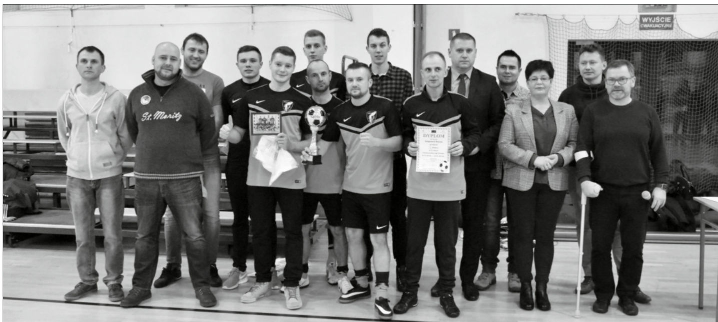
Imigranci Zrecze mistrzami IV CHLF 2018/2019.

Nagrody dla pierwszych trzech drużyn ufundował organizator – Brain&Body – Akademia Prozdrowotnego Rozwoju.