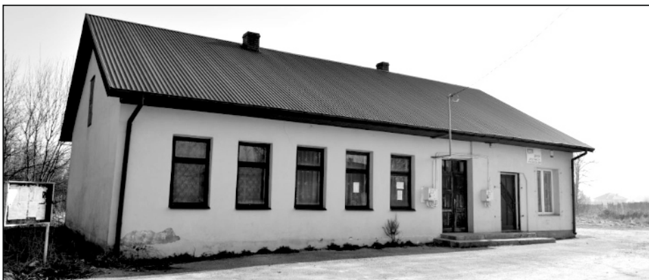
Świetlica w Jasieniu

Wniosek pn. Poprawa efektywności energetycznej budynków użyteczności publicznej na terenie miasta i Gminy Chmielnik złożony przez Gminę uzyskał pozytywną ocenę merytoryczną i został wybrany do dofinansowania przez Instytucję Zarządzającą Regionalnego Programu Operacyjnego Województwa Świętokrzyskiego na lata 2014 – 2020. W ramach Działania 3.3 „Poprawa efektywności energetycznej z wykorzystaniem odnawialnych źródeł energii w sektorze publicznym i mieszkaniowym” zostaną wykonane prace związane z termomodernizacją budynków Chmielnickiego Centrum Kultury, Szkoły Podstawowej w Suchowoli, świetlicy wiejskiej w Szyszczycach oraz świetlicy wiejskiej w Jasieniu. Świetlica w Szyszczycach do tej pory