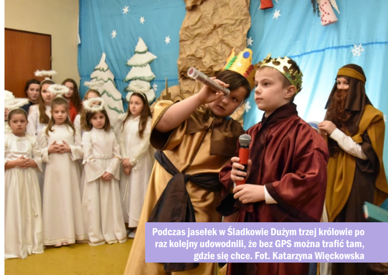
Podczas jasełek w Śładkowie Dużym trzej królowie po raz kolejny udowodnili, że bez GPS można trafić tam, gdzie się chce.