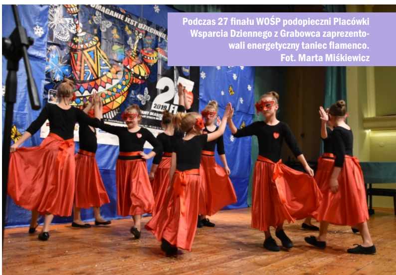
Podczas 27 finału WOŚP podopieczni Placówki Wsparcia Dziennego z Grabowca zaprezentowali energetyczny taniec flamenco.