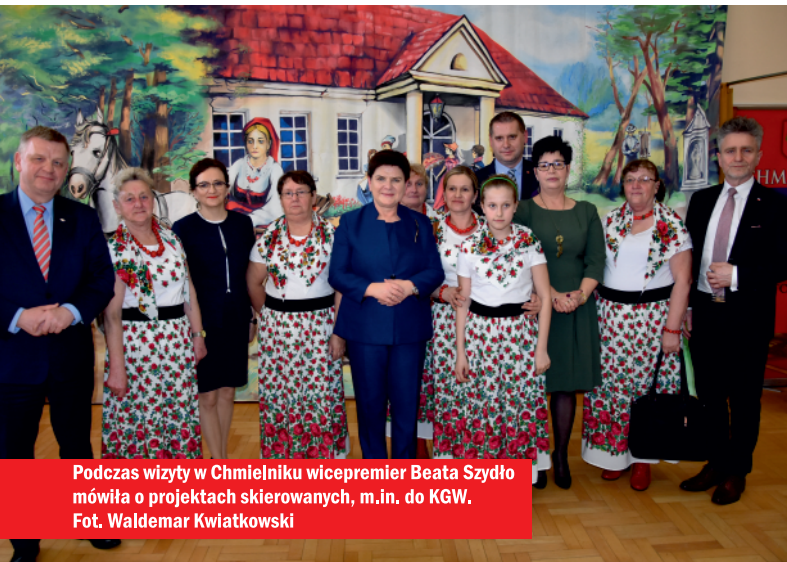
Podczas wizyty w Chmielniku wicepremier Beata Szydło mówiła o projektach skierowanych, m.in. do KGW.