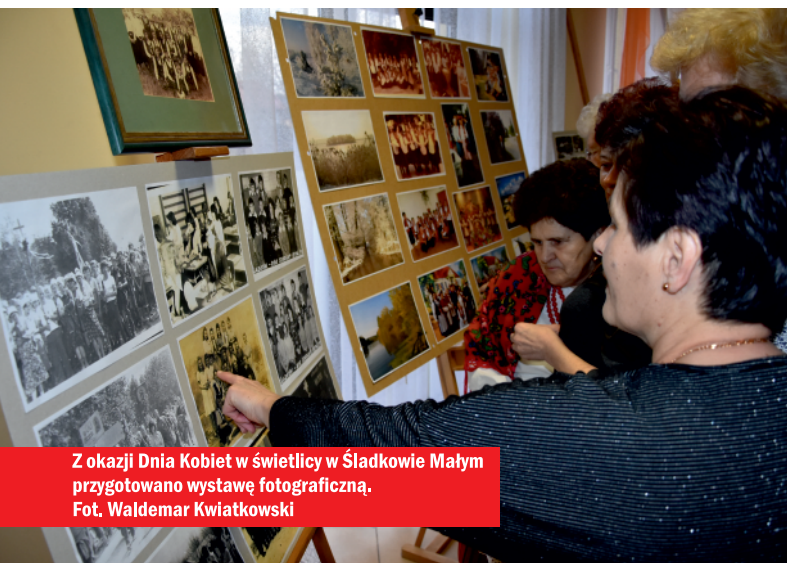
Z okazji Dnia Kobiet w świetlicy w Śladkowie Małym przygotowano wystawę fotograficzną.