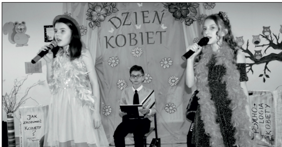
Radosny wieczór w Śladkowie Małym.