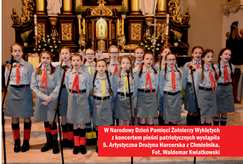
W Narodowy Dzień Pamięci Żołnierzy Wyklętych z koncertem pieśni patriotycznych wystąpiła 5. Artystyczna Drużyna Harcerska z Chmielnika.