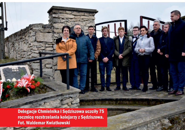
Delegacje Chmielnika i Sędziszowa uczcily 75 rocznicę rozstrzelania kolejarzy z Sędziszowa.