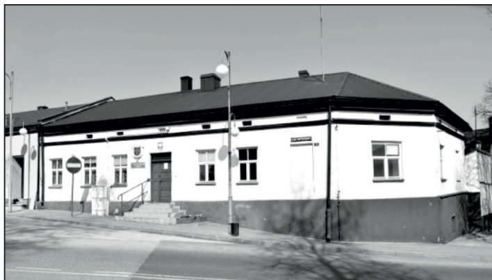
W budynku dawnego urzędu będzie się mieścić Klub Seniora

Wydział Rozwoju Gospodarczego UMiG Chmielnik