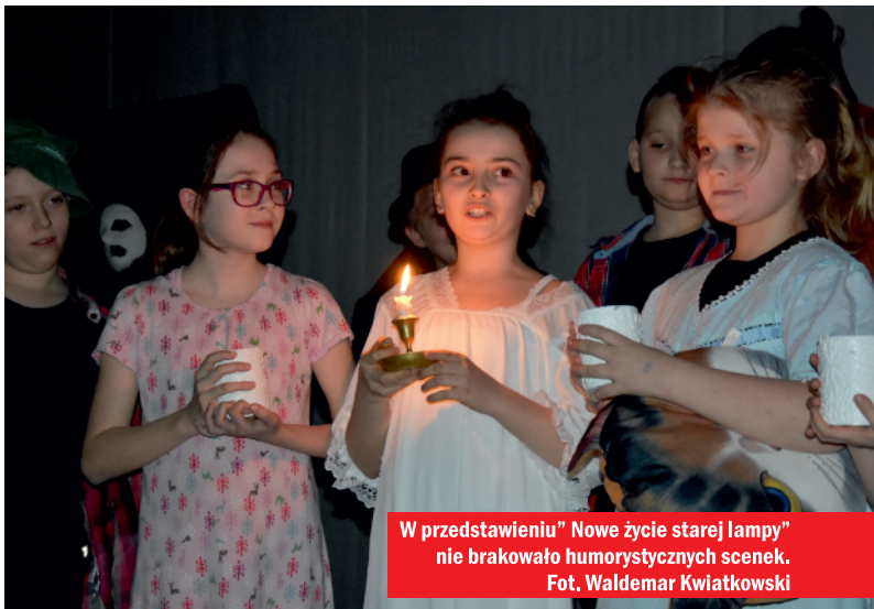
W przedstawieniu „Nowe życie starej lampy” nie brakowało humorystycznych scenek.