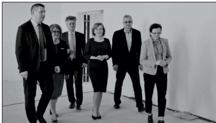
Samorządowcy wizytowali budowę szkoły w Piotrkowicach.