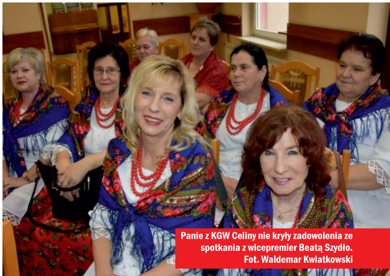
Panie z KGW Celiny nie kryły zadowolenia ze spotkania z wicepremier Beatą Szydło.