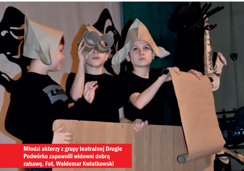
Młodzi aktorzy z grupy teatralnej Drugie Podwórko zapewnili widzowi dobrą zabawę.