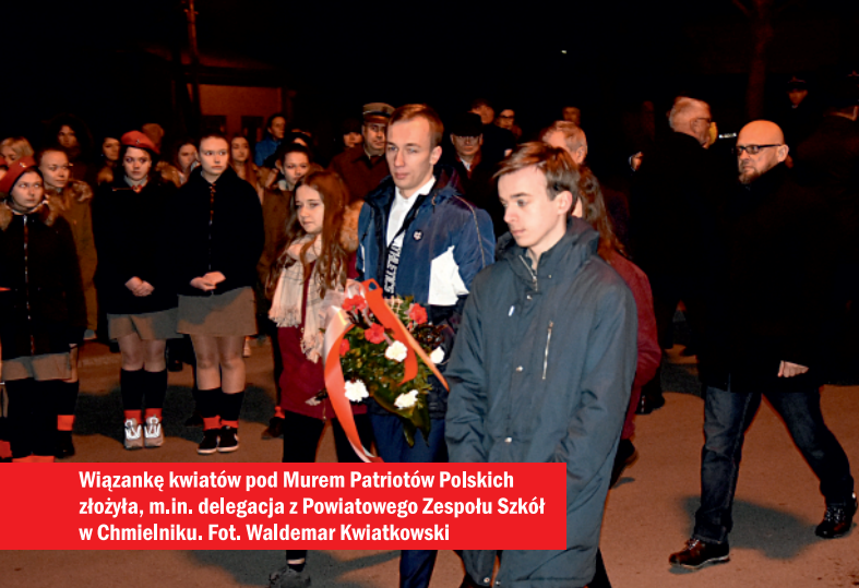
Wiązankę kwiatów pod Murem Patriotów Polskich złożyła, m.in. delegacja z Powiatowego Zespołu Szkół w Chmielniku.