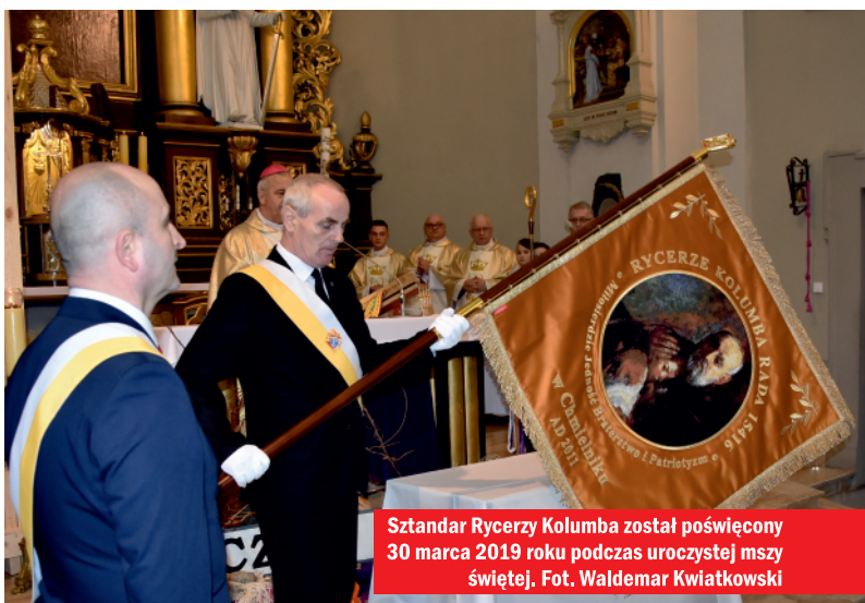
Sztandar Rycerzy Kolumba został poświęcony 30 marca 2019 roku podczas uroczystej mszy świętej.