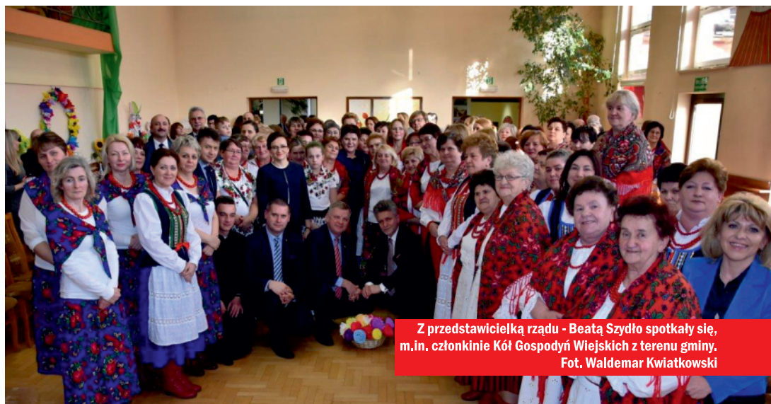
Z przedstawicielką rządu - Beatą Szydło spotkały się, m.in. członkinie Kół Gospodyń Wiejskich z terenu gminy.