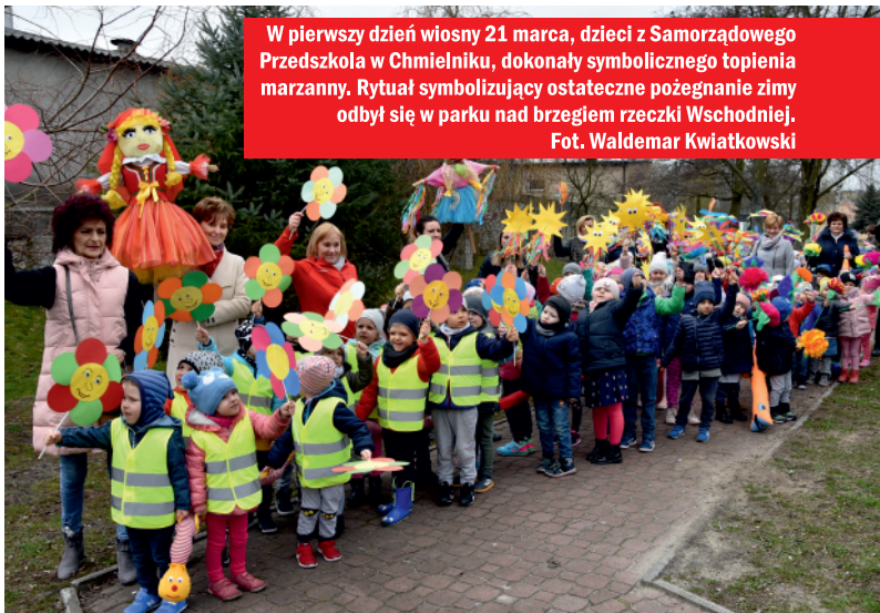
W pierwszy dzień wiosny 21 marca, dzieci z Samorządowego Przedszkola w Chmielniku, dokonały symbolicznego topienia marzanny. Rytuał symbolizujący ostateczne pożegnanie zimy odbył się w parku nad brzegiem rzeczki Wschodniej.