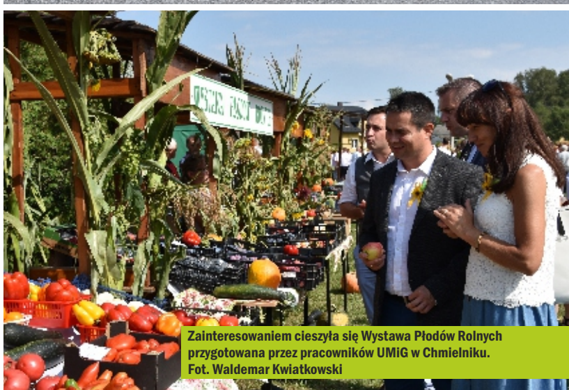
Zainteresowaniem cieszyła się Wystawa Płodów Rolnych przygotowana przez pracowników UMIG w Chmielniku.