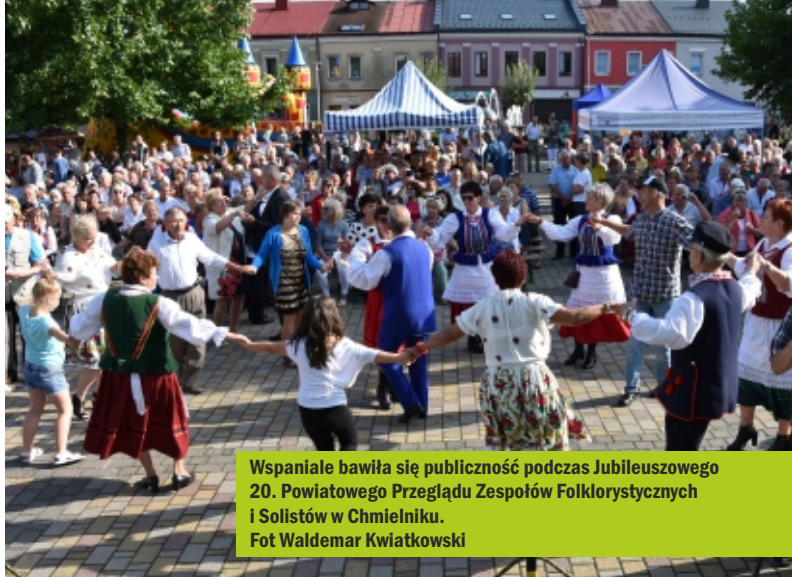
Wspaniale bawiła się publiczność podczas Jubileuszowego 20. Powiatowego Przeglądu Zespołów Folklorystycznych i Solistów w Chmielniku.