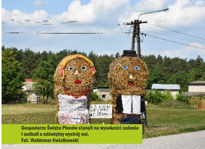
Gospodarze Święta Plonów stanęli na wysokości zadania i zadbali o odświeżony wystrój wsi.