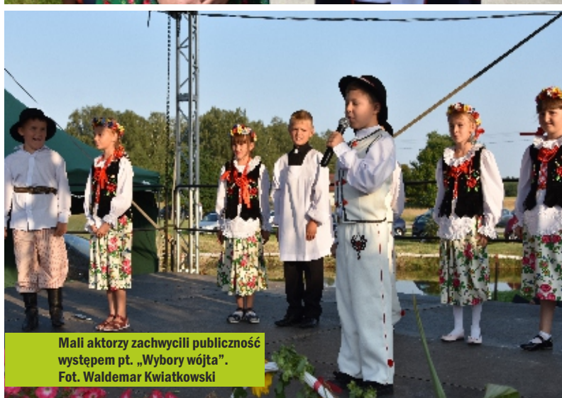
Mali aktorzy zachycili publiczność występem pt. „Wybory wójta”.