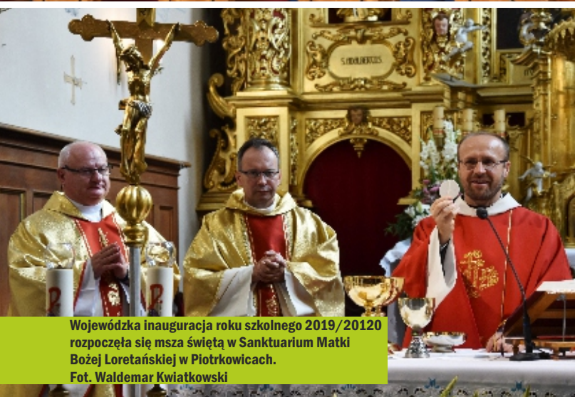
Wojewódzka inauguracja roku szkolnego 2019/2020 rozpoczęła się msza święta w Sanktuarium Matki Bożej Loretańskiej w Piotrkowicach.