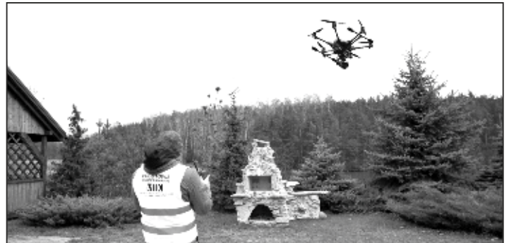
Podczas sesji dokumentacyjno-badawczej użyto drony MIK; Fantom 4 i Yuncer Typhoon z kamerą termowizyjną.