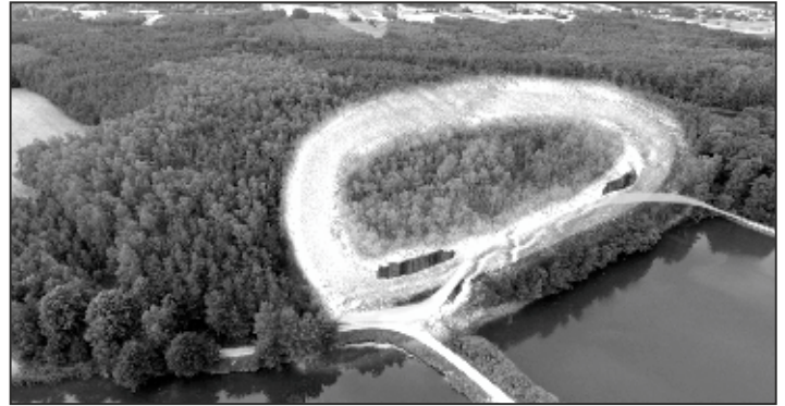
Wizualizacja wałów obronnych oraz koncepcja ekspozycji.

szymi rozmiarami przekraczającymi niekiedy 20 ha) mogła spełniać funkcje ośrodków plemiennych czy terytorialnych, a ponadto mieć charakter refugialny, to znaczy stanowić miejsce, do którego chroniła się okoliczna ludność w razie niebezpieczeństwa.