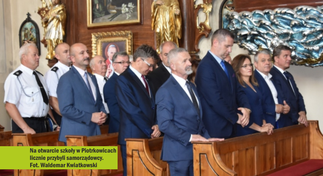
Na otwarcie szkoły w Piotrkowicach licznie przybyli samorządowcy.