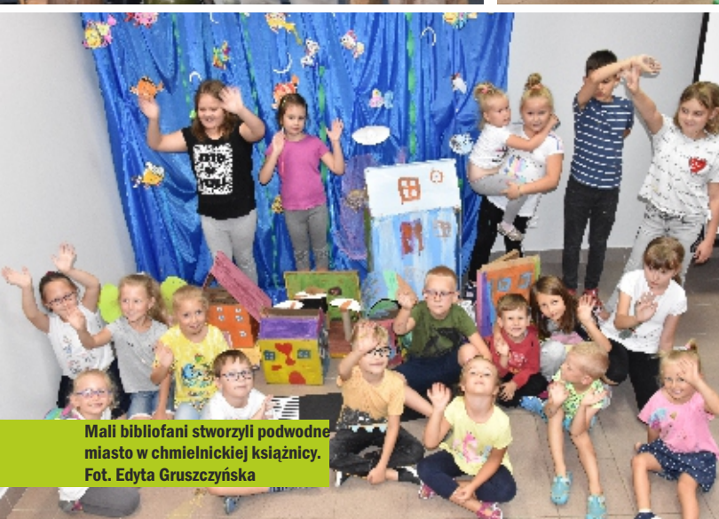
Mali bibliofani stworzyli podwodne miasto w chmielnickiej ksiąźnicy.