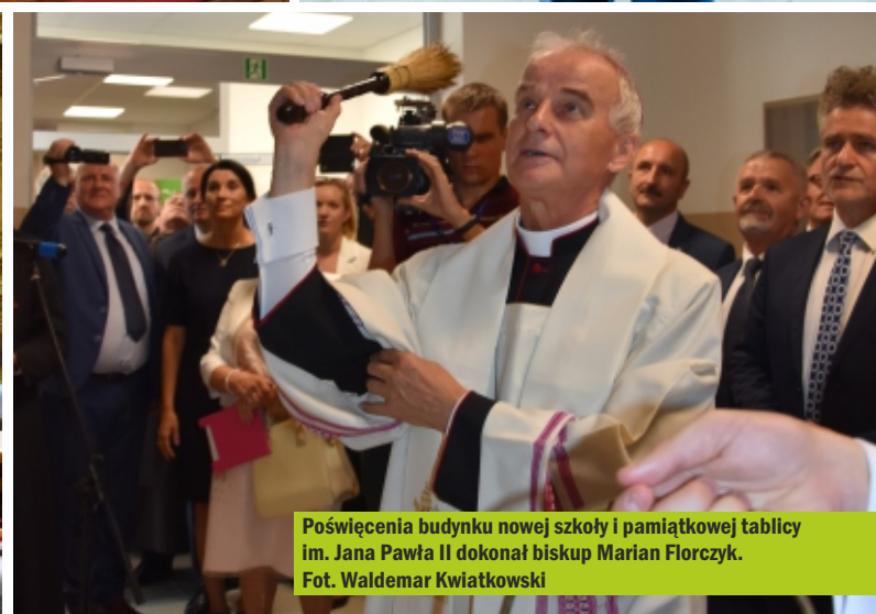
Poświęcenia budynku nowej szkoły i pamiątkowej tablicy im. Jana Pawła II dokonał biskup Marian Florczyk.