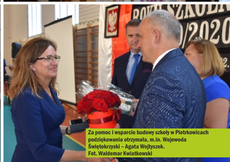
Za pomoc i wsparcie budowy szkoły w Piotrkowicach podziękowania otrzymała, m.in. Wojewoda Świętokrzyski – Agata Wojtysek.