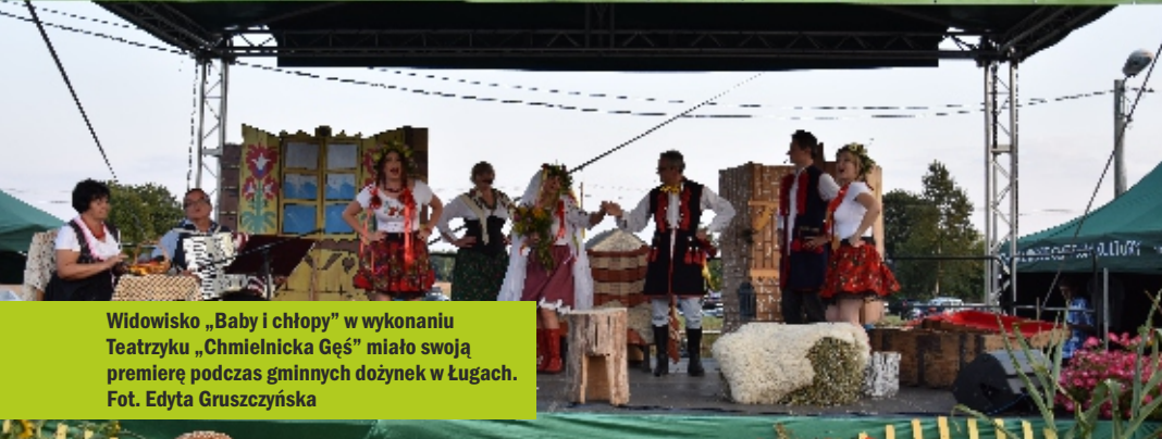
Widowisko „Baby i chłopcy” w wykonaniu Teatryku „Chmielnicka Gęś” miało swoją premierę podczas gminnych dożynek w Ługach.