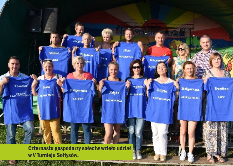
Czternastu gospodarzy sołectw wzięło udział w V Turnieju Sołtysów.