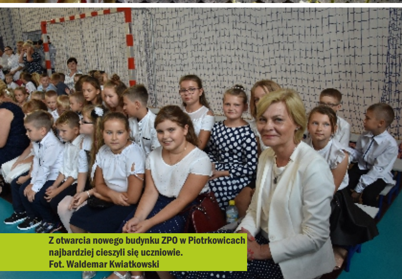
Z otwarcia nowego budynku ZPO w Piotrkowicach najbardziej cieszyli się uczniowie.