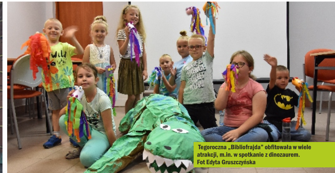
Tegoroczna „Bibliofrajda” obfitowała w wiele atrakcji, m.in. w spotkanie z dinozaurom.