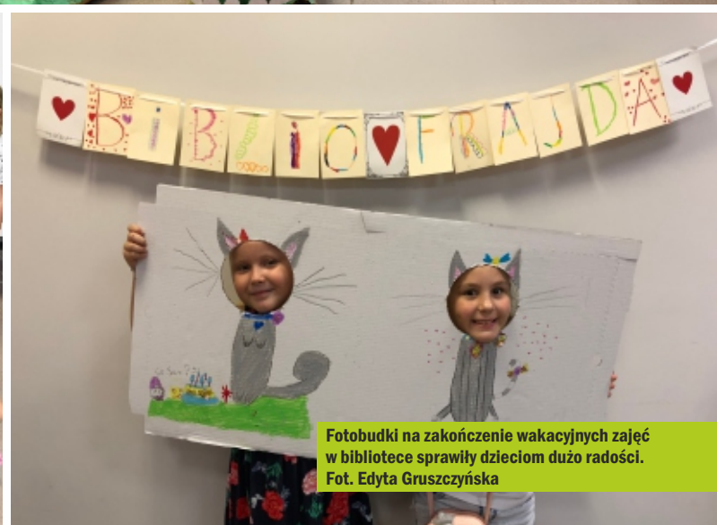
Fotobudki na zakończenie wakacyjnych zajęć w bibliotece sprawiły dzieciom dużo radości.