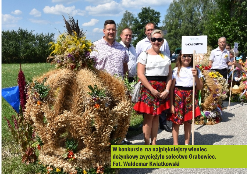
W konkursie na najpiękniejszy wieniec dożynkowy zwyciężyło sołectwo Grabowiec.