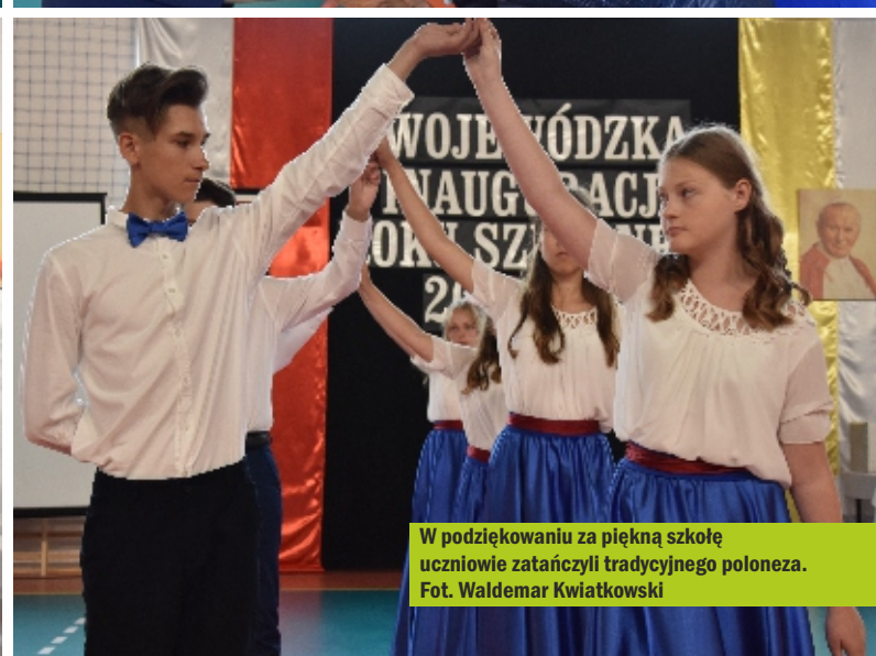
W podziękowaniu za piękną szkołę uczniowie zatańczyli tradycyjnego poloneza.