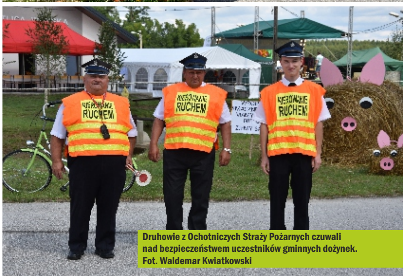
Druhowie z Ochotniczych Straży Pożarnych czuwali nad bezpieczeństwem uczestników gminnych dożynek.