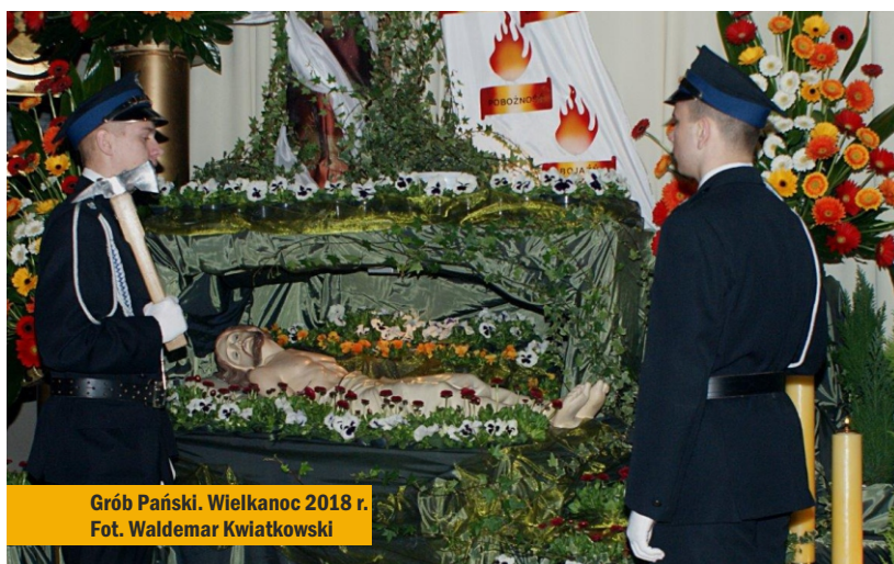
Grób Pański. Wielkanoc 2018 r.