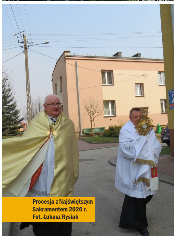
Procesja z Najświętszym Sakramentem 2020 r.