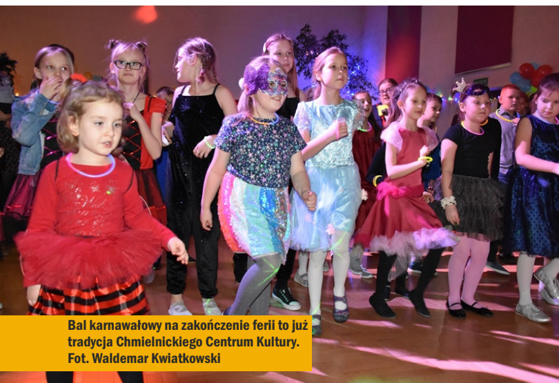
Bał karnawałowy na zakończenie ferii to już tradycja Chmielnickiego Centrum Kultury.