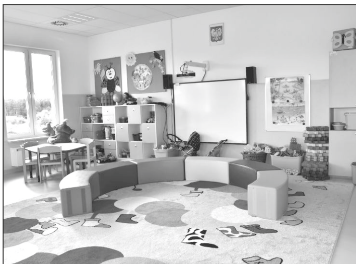
Salę w rozbudowanym przedszkolu będą równie estetyczne jak w piotrkowickiej placówce.

Projekt budowlany obiektu ma powstać do końca listopada bieżącego roku. Opracuje go Specjalistyczne Biuro Inwestycyjno-Inżynierskie PROSTA-PROJEKT z Piotrkowic, które wygrało przetarg w tym zakresie.