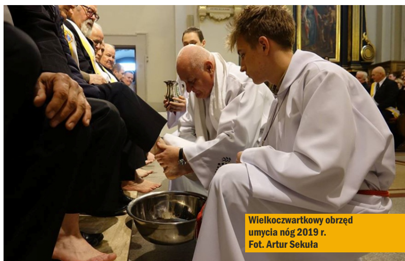
Wielkoczwartkowy obrzęd umycia nóg 2019 r.