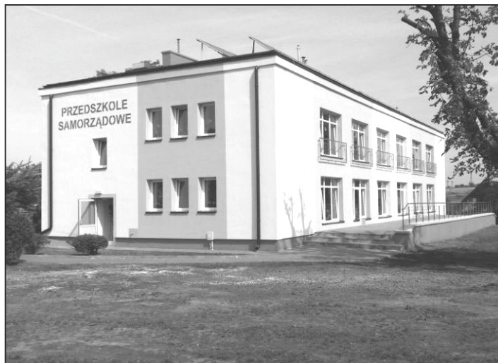
Budynek przedszkola przeszedł termomodernizację w 2018 roku.

Dwa lata temu budynek został poddany kompleksowej termomodernizacji, która znacznie poprawiła komfort użytkowania. Ściany zewnętrzne i stropodach zostały ocieplone, wymieniono okna i drzwi, zmodernizowano system grzewczy (na instalację gazową) i c.w.u. Na dachu zamontowano panele fotowoltaiczne. Przebudowano również system wentylacji i wymieniono oświetlenia na energooszczędne. Konieczne było także wykonanie izolacji przeciwwilgociowej.