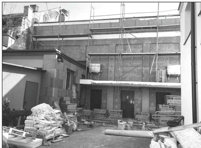
Prace termomodernizacyjne w budynku ChCK.