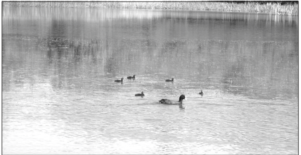
Nad zalewem Andrzejówka można spotkać zagrożoną wyginięciem tyską zwyczajną.