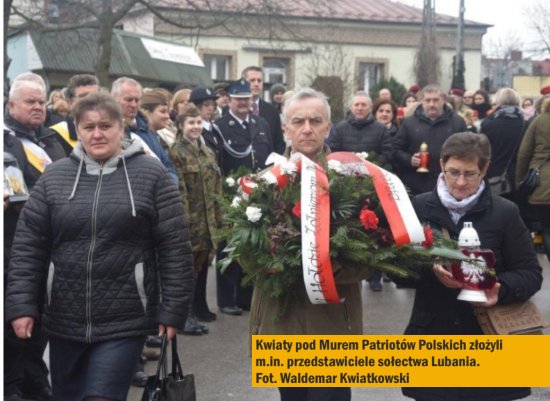
Kwiaty pod Murem Patriotów Polskich złożyli m.in. przedstawiciele sołectwa Lubania.