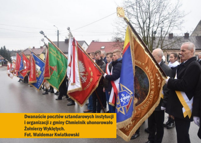
Dwanaście pocztów sztandarowych instytucji i organizacji z gminy Chmielnik uhonorowało Żołnierzy Wyklętych.