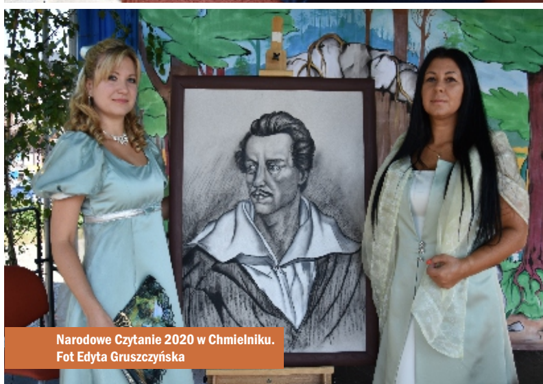
Narodowe Czytanie 2020 w Chmielniku.