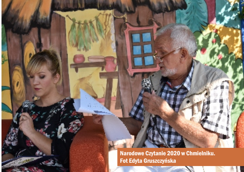
Narodowe Czytanie 2020 w Chmielniku.