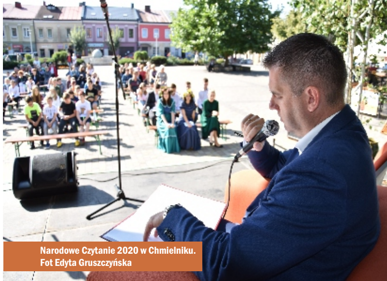
Narodowe Czytanie 2020 w Chmielniku.