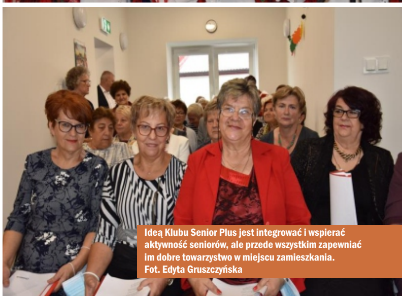
Ideą Klubu Senior Plus jest integrować i wspierać aktywność seniorów, ale przede wszystkim zapewniać im dobre towarzystwo w miejscu zamieszkania.