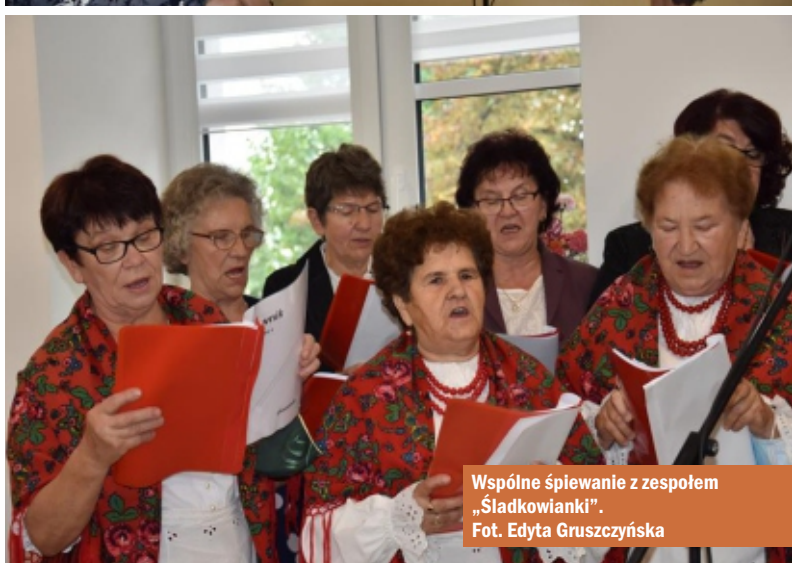
Wspólne śpiewanie z zespołem „Śtadkowiarki”.