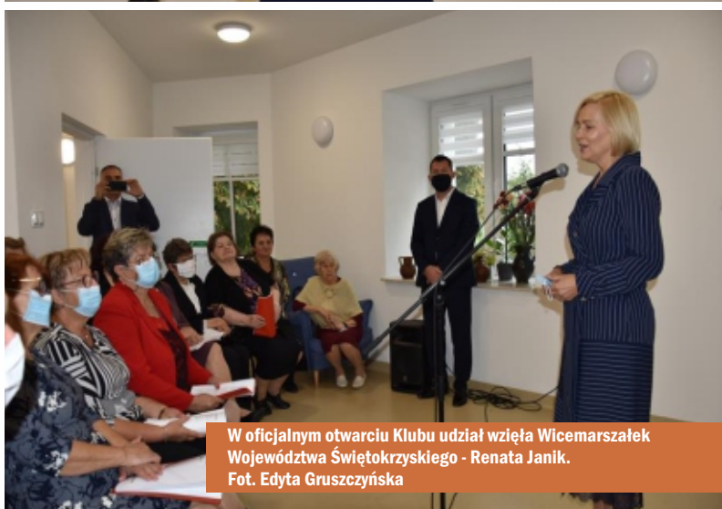
W oficjalnym otwarciu Klubu udział wzięła Wicemarszałek Województwa Świętokrzyskiego - Renata Janik.