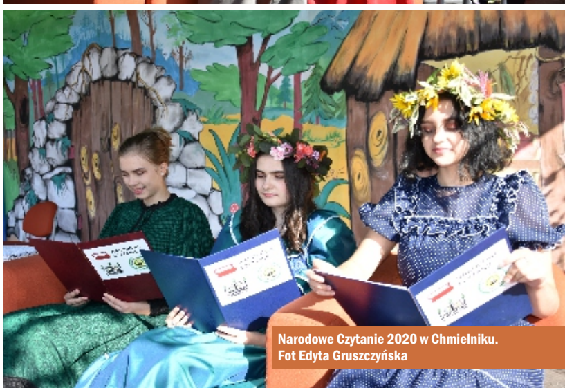
Narodowe Czytanie 2020 w Chmielniku.