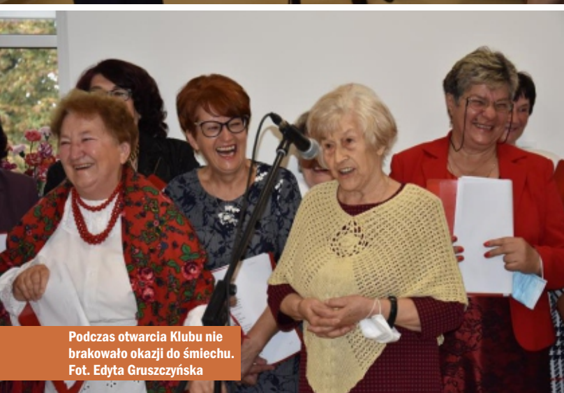
Podczas otwarcia Klubu nie brakowało okazji do śmiechu.