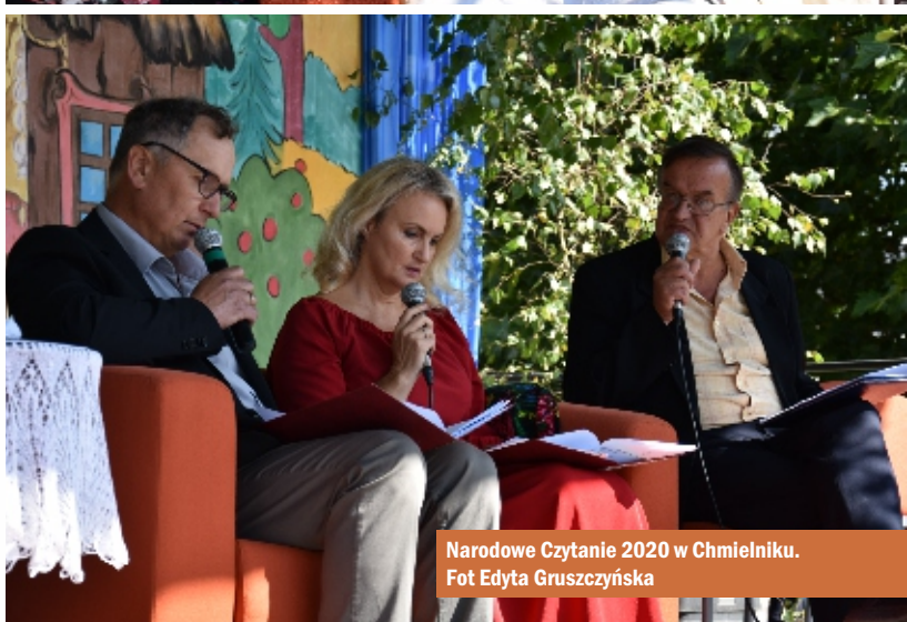
Narodowe Czytanie 2020 w Chmielniku.