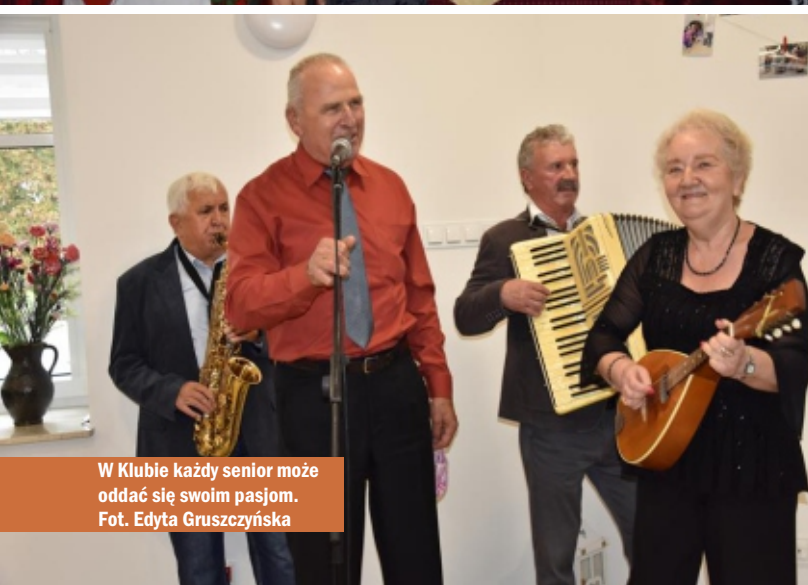
W Klubie każdy senior może oddać się swoim pasjom.