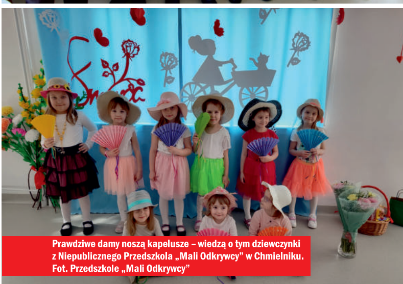
Prawdziwe damy noszą kapelusze – wiedzą o tym dziewczynki z Niepublicznego Przedszkola „Mali Odkrywcy” w Chmielniku.