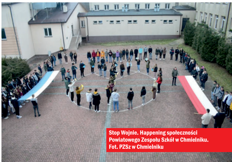
Stop Wojnie. Happening społeczności Powiatowego Zespołu Szkół w Chmielniku.