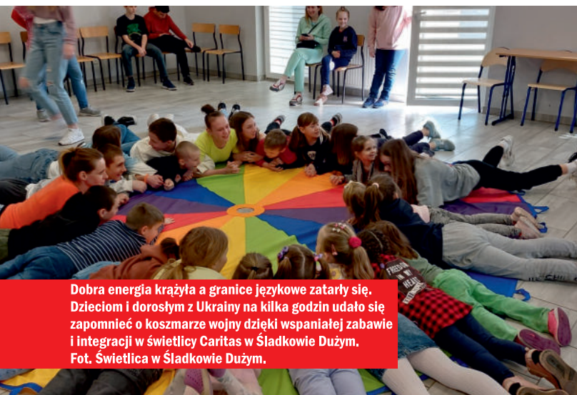
Dobra energia krążyła a granice językowe zatarty się. Dzieciom i dorosłym z Ukrainy na kilka godzin udało się zapomnieć o koszmarze wojny dzięki wspaniałej zabawie i integracji w świetlicy Caritas w Śladkowie Dużym.