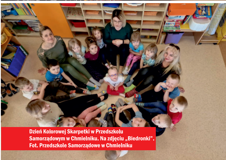
Dzień Kolorowej Skarpetki w Przedszkolu Samorządowym w Chmielniku. Na zdjęciu „Biedronki”.