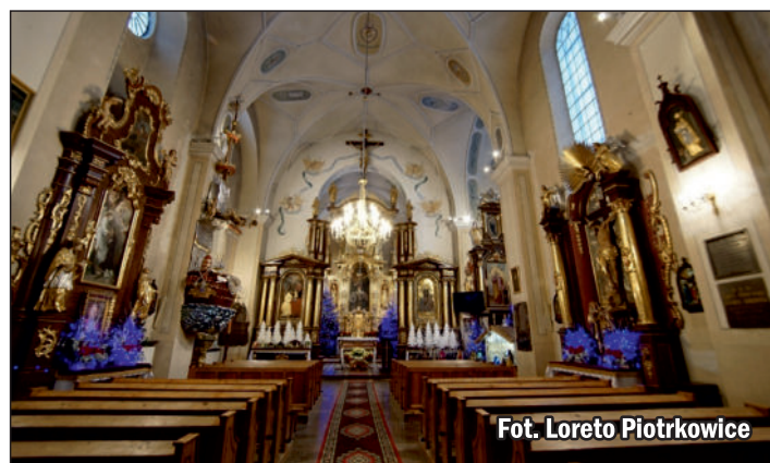
Fot. Loreto Piotrkowice