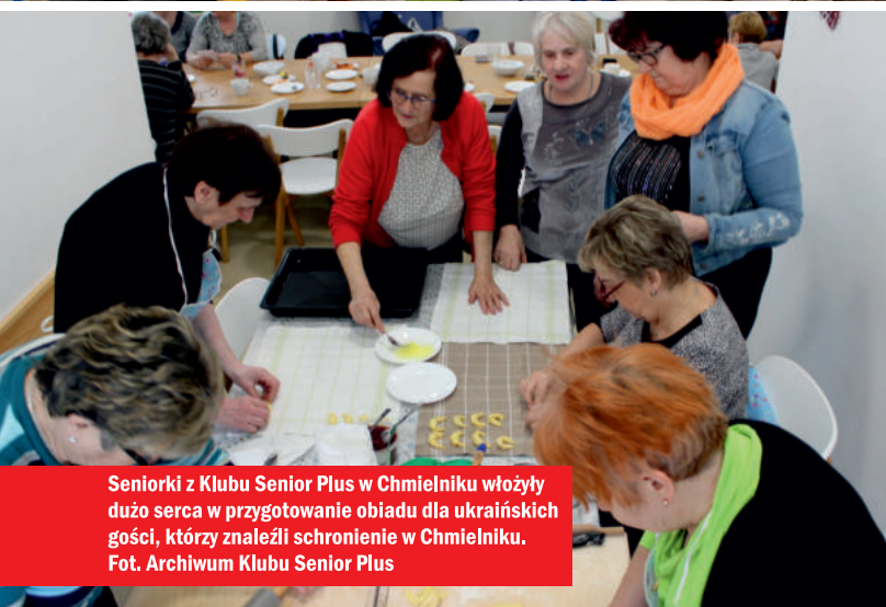
Seniorki z Klubu Senior Plus w Chmielniku włożyły dużo serca w przygotowanie obiadu dla ukraińskich gości, którzy znaleźli schronienie w Chmielniku.