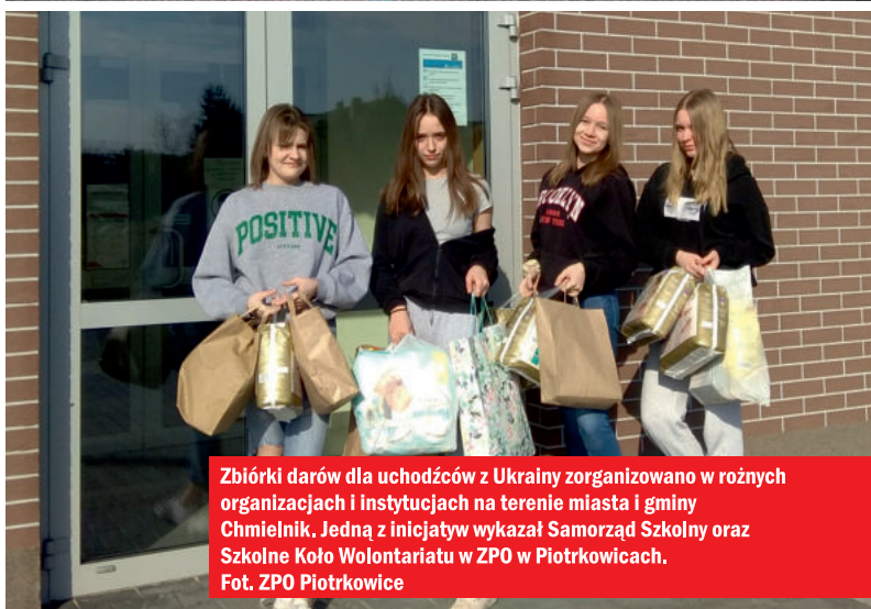
Zbiórki darów dla uchodźców z Ukrainy zorganizowano w różnych organizacjach i instytucjach na terenie miasta i gminy Chmielnik. Jedną z inicjatyw wykała Samorząd Szkolny oraz Szkolne Koło Wolontariatu w ZPO w Piotrkowicach.