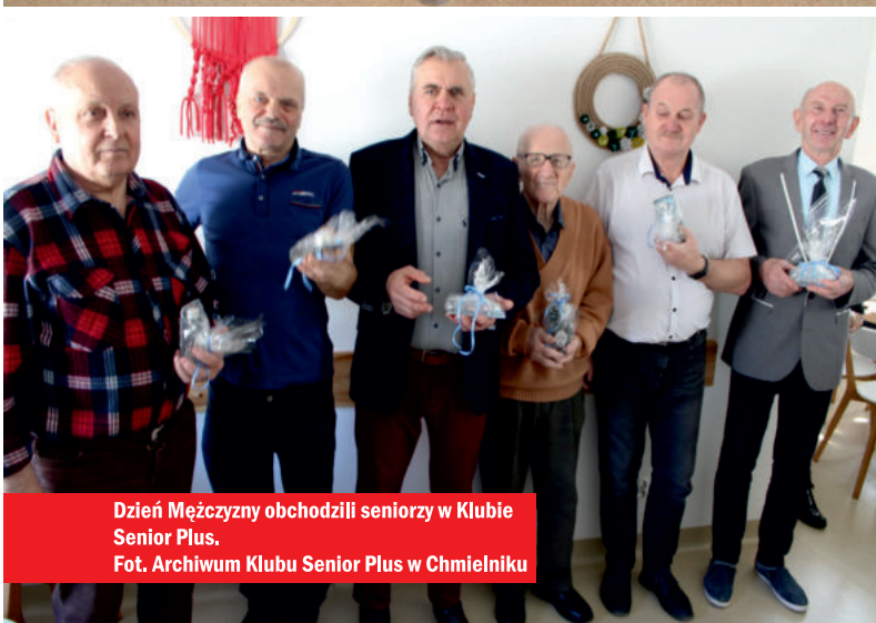
Dzień Mężczyzny obchodzili seniorzy w Klubie Senior Plus.