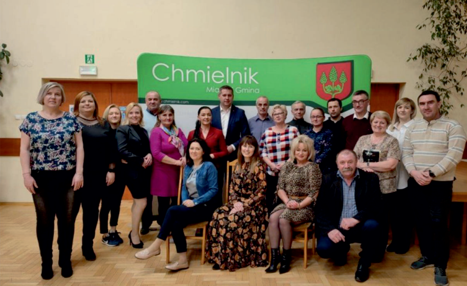
22 marca 2022 roku w Chmielnickim Centrum Kultury przedstawiciele samorządu Chmielnika spotkali się z sołtysami. Gospodarze sołectw z okazji obchodzonego 11 marca Dnia Sołtysa otrzymali najnowszą publikację „Krzyże, Kapliczki i Figury Przydrożne w Gminie Chmielnik”., autorstwa Wojciecha Książka i Mariana Gucwy.