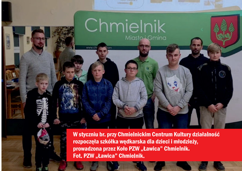
W styczniu br. przy Chmielnickim Centrum Kultury działalność rozpoczęła szkoła wędkarska dla dzieci i młodzieży, prowadzona przez Koło PZW „Ławica” Chmielnik.