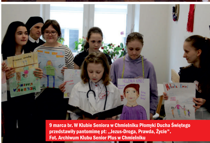
9 marca br. W Klubie Seniora w Chmielniku Piomyki Ducha Świętego przedstawiły pantomimę pt.: „Jezus-Droga, Prawda, Życie”.