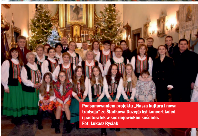
Podsumowaniem projektu „Nasza kultura i nowa tradycja” ze Śladkowa Dużego był koncert kołed i pastorałek w sędziejowickim kościele.