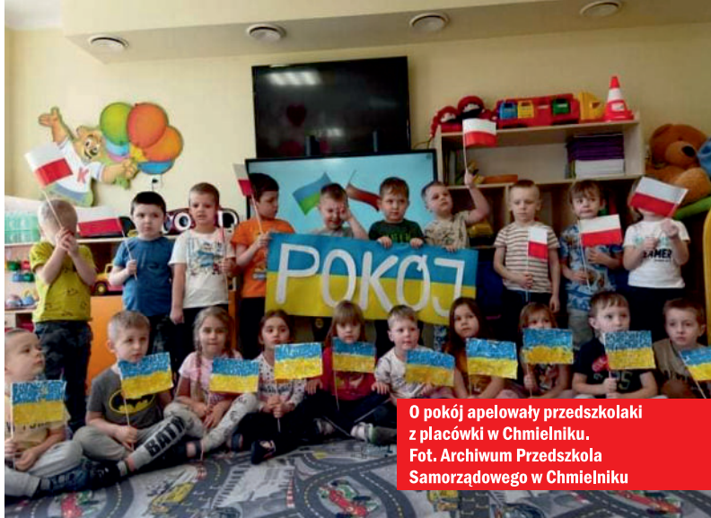
O pokój apelowały przedszkolaki z placówki w Chmielniku.