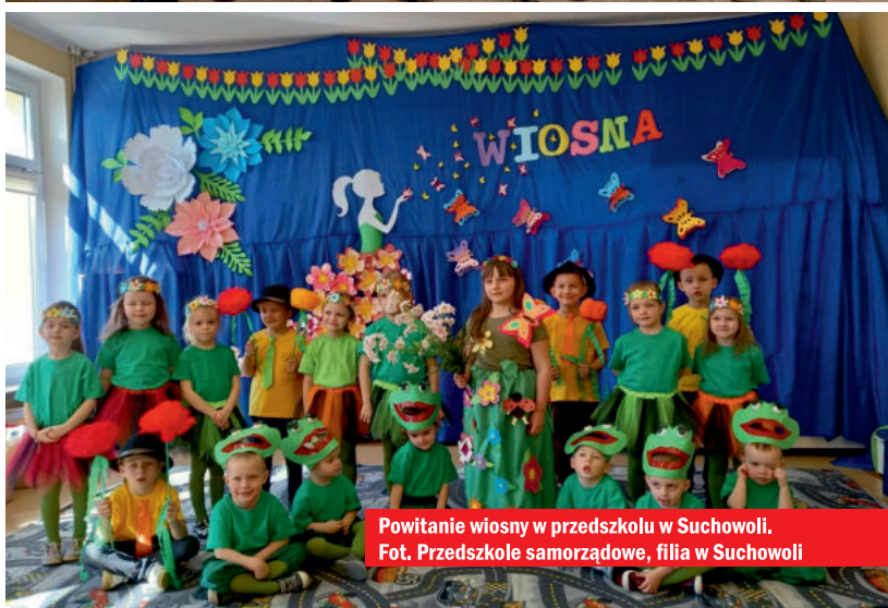
Powitanie wiosny w przedszkolu w Suchowoli.