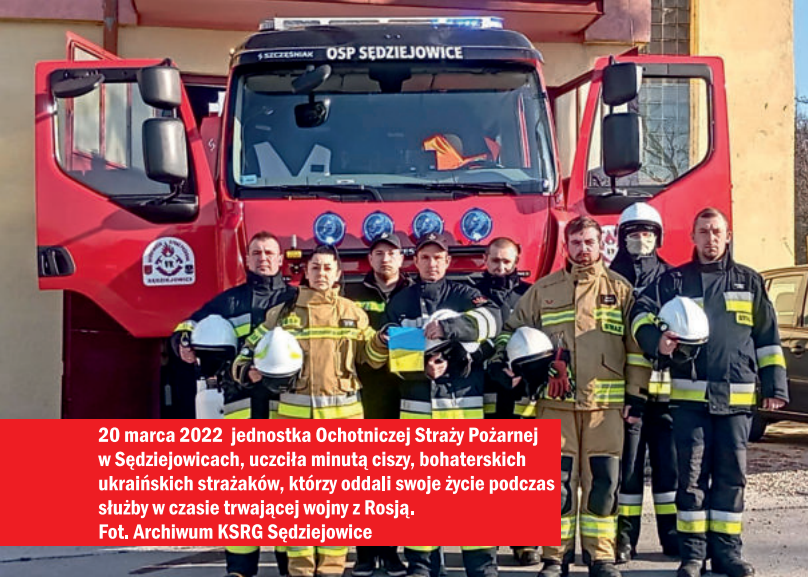
20 marca 2022 jednostka Ochotniczej Straży Pożarnej w Sędziejowicach, uczciła minutą ciszy, bohaterskich ukraińskich strażaków, którzy oddali swoje życie podczas służby w czasie trwającej wojny z Rosją.