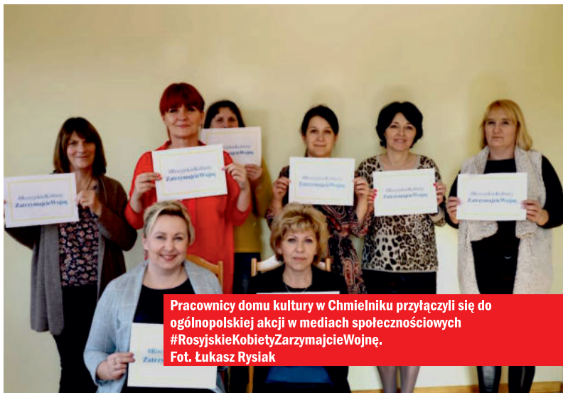
Pracownicy domu kultury w Chmielniku przyłączyli się do ogólnopolskiej akcji w mediach społecznościowych #RosyjskieKobietyZarzymajcieWojnę.